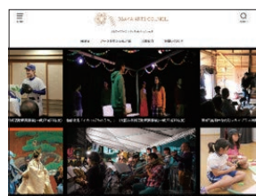
ホームページトップ